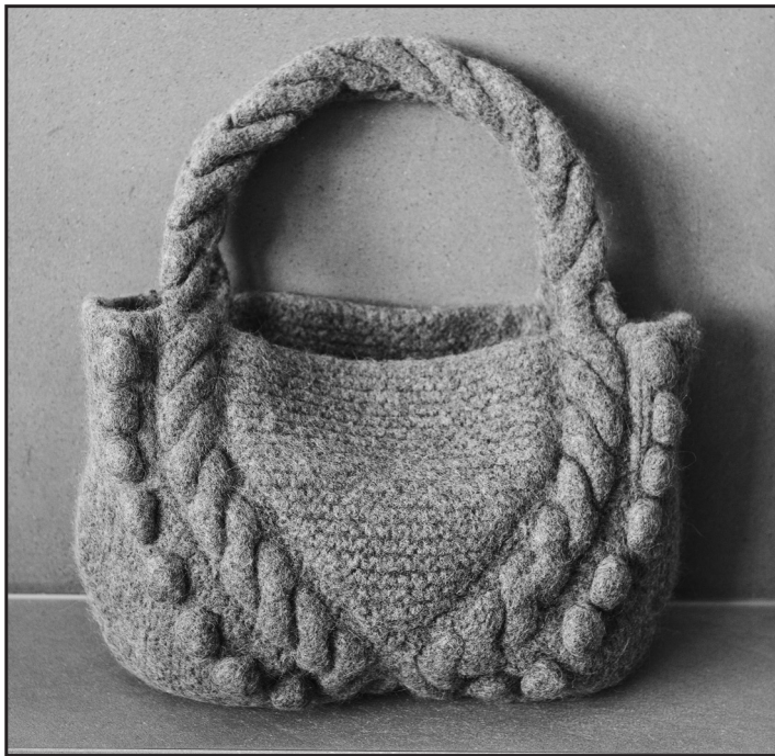
MODELL 53 Filtz tasche im Zopfknoppen- muster Gewaschen ca. 32 x 48 cm Ungewaschen ca. 46 x 60 cm

Die Zahlen in Klammern geben die Maße vor dem Filzen, die außerhalb der Klammer die Maße danach an.